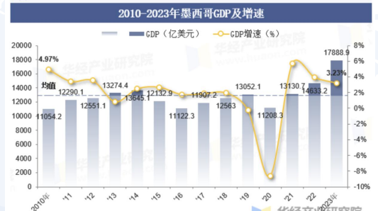
2023年，墨西哥GDP总量达1.8万亿美元，GDP年增长率为3.23%

2023年，墨西哥GDP总量达1.8万亿美元，GDP年增长率为3.23%，总人口达1.3亿人，人均GDP (PPP) 为13926.11美元。2023年1-8月中国与墨西哥双边货物进出口额为6630115.82万美元，相比2022年同期增长了286077.57万美元，同比增长4.8%。过去20年间，中国企业在墨西哥的投资额高达21.6亿美金，并且经贸关系仍在不断的成长中，中墨两国之间正在进行的几个大型基建项目，在未来几年将带来约20亿美金的市场增长，对于中国企业来说，越早进入意味着能分享越大的增长红利。